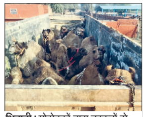
भिवानी। गोसेवकों द्वारा तस्करो से छुटाए गए ऊंट।