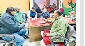
कार्यालय, मिवानी में भारत रत्न श्रद्धेय अटल बिहारी वाजपेयी की स्मृति वर्ष को समर्पित 'अटल स्मृति वर्ष' के सफल आयोजन को लेकर जिला स्तरीय टोली की एक महत्वपूर्ण बैठक का आयोजन किया गया। बैठक का