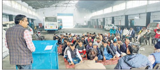
मिवानी। मांगों को लेकर द्वार सभा को संबोधित करते एक कर्मचारी नेता।