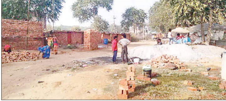
महेंद्रगढ़। नगर पालिका के नए भवन के लिए कार्य करते मजदूर।

ऑटो मार्केट के पीछे खाली जमीन पर नगर पालिका (नपा) की ओर से नया भवन बनाया जाएगा। ठेकेदार की ओर से भवन बनाने के लिए कार्य शुरू कर दिया गया। ठेकेदार द्वारा नपा के यह भवन 15 महीने में तैयार करके देना होगा। नगर पालिका की ओर से नए भवन के लिए तीन करोड़ 20 लाख रुपये खर्च किए जाएंगे। ठेकेदार की ओर से नए भवन को आधुनिक बनाया जाएगा। फिलहाल