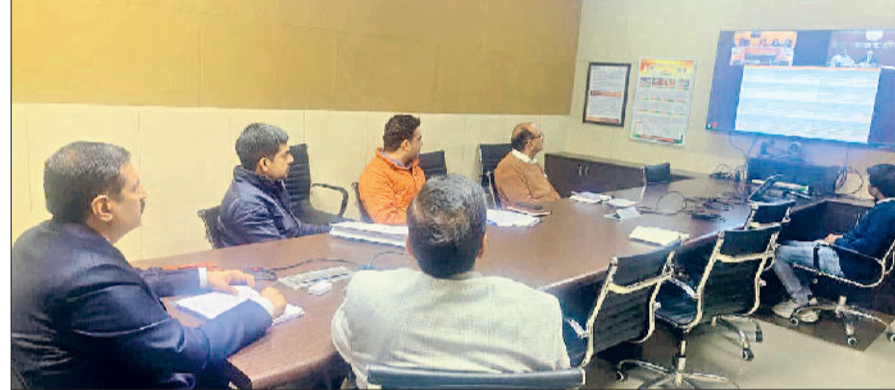
मिवानी। वीडियो कॉन्फ्रेंस से रिव्यू मीटिंग लेते अतिरिक्त मुख्य सचिव।

स्वीकृति मिल सके। उन्होंने निर्देश दिए कि वे पिछले वर्षों में बाढ़ व जलभराव के कारण फसल क्षति पर वितरित मुआवजे का विस्तृत विवरण उपलब्ध कराएं। उन्होंने पूर्व में स्वीकृत बाढ़ नियंत्रण कार्यों की प्रगति की भी समीक्षा की तथा संवेदनशील क्षेत्रों में अतिरिक्त आवश्यक उपायों पर चर्चा की।