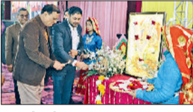
भिवानी। द्वीप प्रज्ज्वलित करके कार्यक्रम का शुभारंभ करावते हुए।