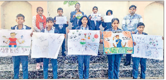
महेंद्रगढ़। बनाए हुए पोस्टर दिखाते विद्यार्थी।